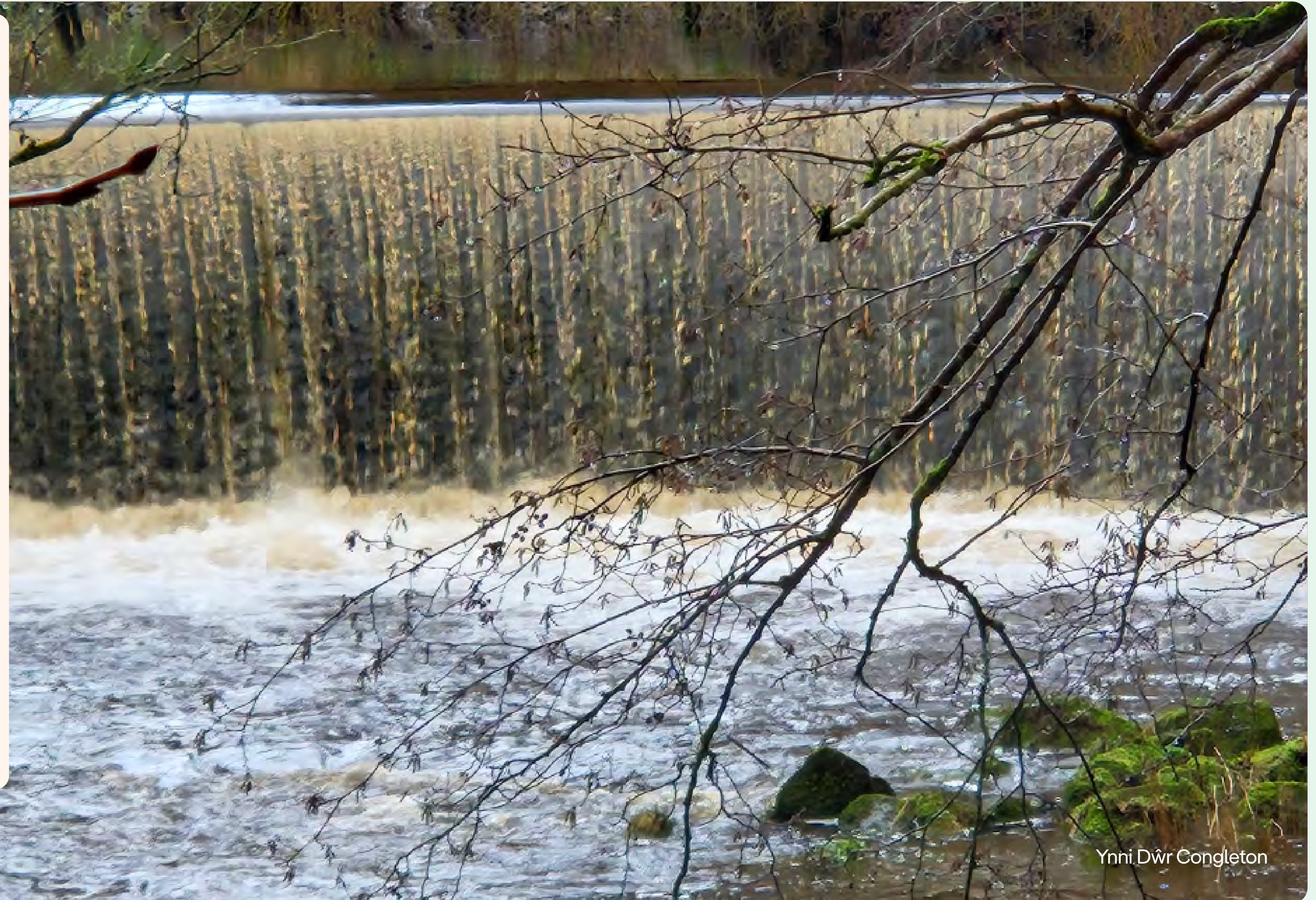
Ynni Dŵr Congleton

Er mwyn goresgyn heriau'n ymwneud â chynllunio, sicrhauodd y grŵp gefnogaeth y gymuned ehangach drwy ymgysylltu a rhannu gwybodaeth. Roedd hyn yn golygu y rhoddwyd caniatâd i'r cynllun pan gyflwynwyd y penderfyniad gerbron gwrandawriad y pwyllgor cynllunio.